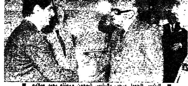
الرئيس الجميل يرحب بالرئيس شعورون ويهنئه بعيد ميلاده